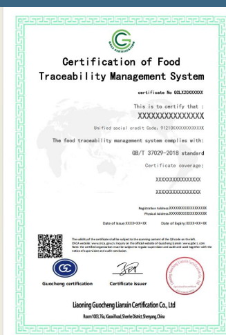
食品可追溯管理体系