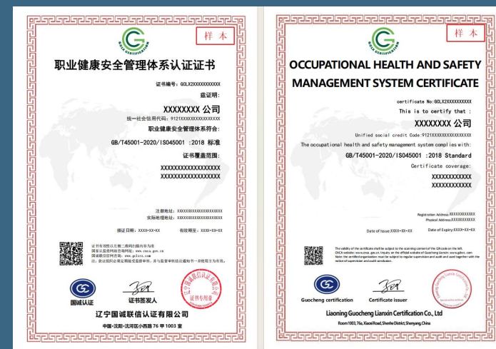
职业健康安全管理体系