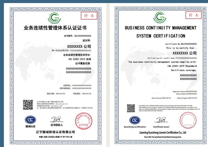
业务连续性管理体系