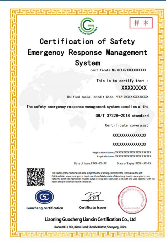
安全应急响应管理体系