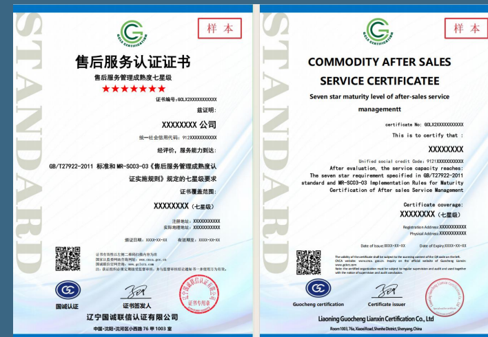
售后服务管理成熟度认证