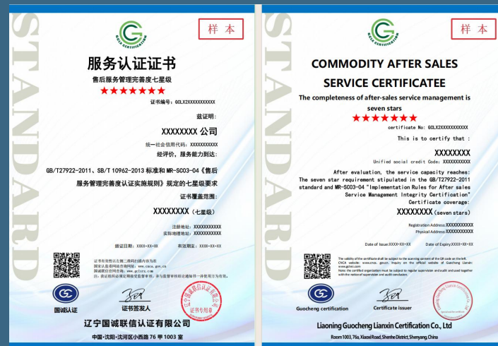
售后服务管理完善度认证