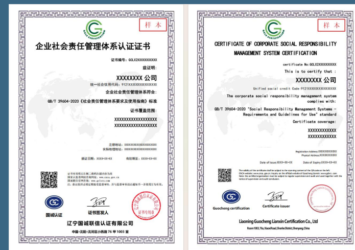
企业社会责任管理体系