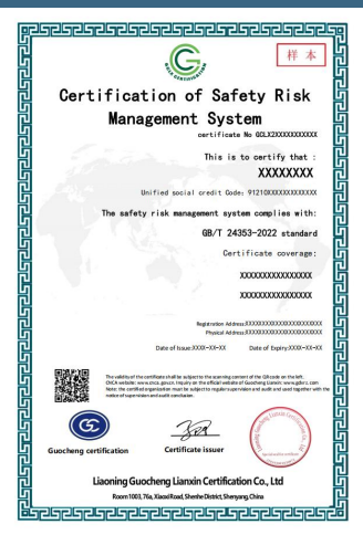
安全风险管理体系